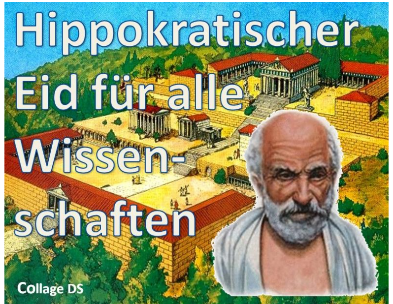
Bild-Rekonstruktion der späteren Heilstätte Asklepieion des Arztes Hippokrates 430 v.Chr. auf der griechischen Insel Kos.

»Wie zum Arzt neben der medizinisch-technischen Ausbildung auch eine charakterliche Erziehung gehört, die ihn selbst die gefährlichsten Hilfsmittel - Messer, Narkotika, Gifte - nur zum Wohle des Kranken verwenden lässt, so ist es unerlässlich, dafür zu sorgen, dass auch die Wissenschaftler ihre ungeheure Macht, die sie zum Herrn über Leben und Tod ganzer Völker, ja der ganzen Menschheit machen kann, nur zu deren Wohle verwenden. Während früher die Eignung für die eigentliche wissenschaftliche Forschung das hervorstechendste Merkmal des Forschers bildete, wird in Zukunft noch etwas anderes hinzukommen müssen, ein besonders hohes Berufsethos, ein auf das feinste ausgeprägtes Verantwortungsbewusstsein gegenüber den Folgen der Forschung für die Menschheit. Es wird zu erwägen sein, ob zu diesen auf moralischem Gebiet liegenden Ansprüchen an die Forscherpersönlichkeit noch