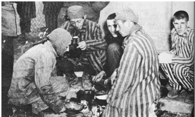
Allach: KZ-Häftlinge erhalten von der US-Army Essen nach ihrer Befreiung am 30. April 1945

Nach meiner mehrjährigen Forschungsarbeit zum KZ-Außenlagerkomplex Dachau-Allach haben sich die Behörden nun entschlossen, auf dem ehemaligen KZ-Gelände in München nach den sterblichen Überresten ehemaliger KZ-Häftlinge zu graben. Die Lagergemeinschaft Dachau hatte im Herbst vorigen Jahres wegen „Störung der Totenruhe“ einen Strafantrag gestellt, da sich auf dem Gelände ein Schrotthandel ausgebreitet hatte und Tiefbauarbeiten vornahm. Die Presse berichtete darüber. Bei Kanalarbeiten Anfang der 50er-Jahre fand man 55 Leichen entlang der Kanaltrasse, die geborgen und auf einem provisorischem KZ-Friedhof beerdigt wurden. Eine systematische Grabung auf dem Gelände unterblieb jedoch. Pläne der Massengräber, die ehemalige KZ-Häftlinge den Behörden übergeben hatten, wurden zwar ständig bestätigt, waren jedoch bis heute in den Akten nicht auffindbar. Umso mehr Hinweise ergeben sich aus dem Vergleich von alliierten Luftbildaufnahmen. Ein Luftbild vom 20. April 1945 zeigt an fünf Stellen zugeschüttete