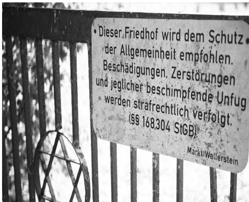
Jüdischer Friedhof in Deutschland 2016.