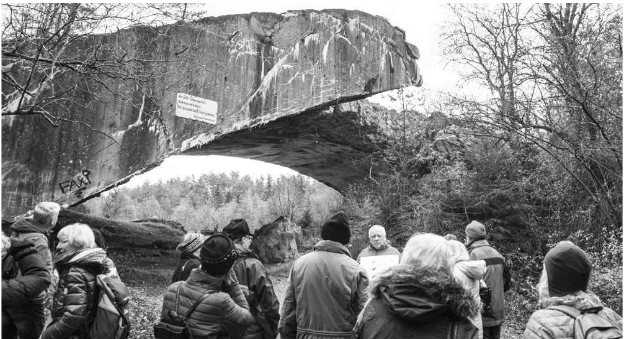
Die ver.di/Naturfreunde-Gruppe mit Franz Langstein unter den Resten des letzten Bunkerbogens