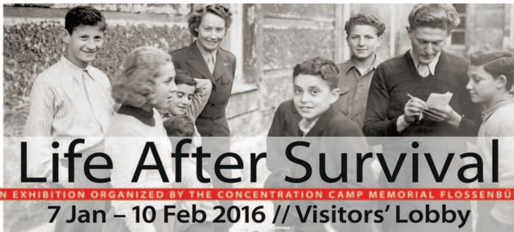
Bild: In einer Größe von 1,75 m x 4,60 m ist dieses Banner im Eingangsbereich der Vereinten Nationen in New York zu sehen, das auf unsere Ausstellung hinweist. Dieser erstklassige Ausstellungsort wird unser Projekt der Verständigung zwischen Generationen und Nationen weiter beflügeln.

Die Ausstellung bietet auch einen Anreiz, sich der Bedürfnisse traumatisierter junger Flüchtlinge heute bewusst zu werden und was getan werden muss, ihnen jetzt zu helfen.