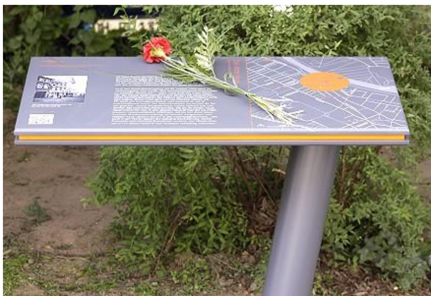
Gedenktafel "Rotes Haus"

Wenn der Pulverturm so oder so explodiert, wird es im bürgerlichen Lager wieder keiner vorausgesehen haben. Aber dann könnte die Zeit kommen, in der man sich der frühen Kämpfer für eine sozialistische Gesellschaftsordnung erinnert. Dann wird man sich wieder an Robert Stamm erinnern, den die Nazijustiz hinrichten ließ und dessen Namen das KPD-Parteihaus in der Lindenhofstraße trug. Und nicht nur an Rosa Luxemburg und Karl Liebknecht und die unzähligen anderen von reaktionärem Militär und Hitlers Justizfaschisten ermordeten Kommunisten wird man sich erinnern, sondern auch an Felix Halle und die vielen anderen aufrechten Kommunisten, die von Stalins Justizterroristen verurteilt wurden. Und man wird endlich die unzähligen Justizopfer der antikommunistischen Nachkriegsjustiz der BRD rehabilitieren, von denen viele - auch einige der hier Versammelten - neben mir vor Gericht gestanden haben. Und dann wird die Stunde für nachfolgende Generationen schlagen, sich zu entscheiden, ob sie lieber in die von den Machthabern der USA und ihren globalen Mitläufern angezettelten Kriege ziehen wollen, oder ob sie den Profiteuren der Kriege und ihren Wegbereitern den Kampf ansagen wollen.