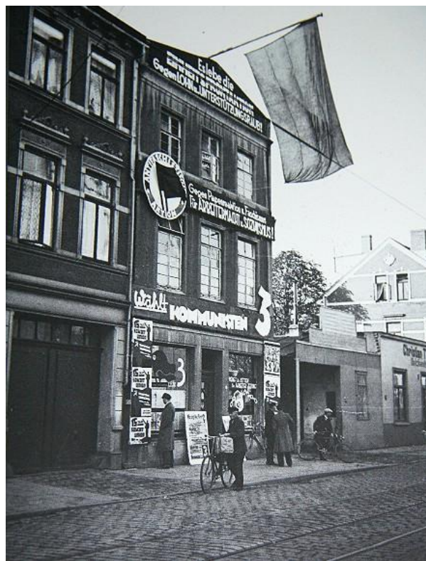
Das Rote Haus vor der Machtübernahme der Faschisten

Es sollte auch nicht in Vergessenheit geraten, dass es wiederum Kommunisten gewesen sind, die den Anfängen einer vom Ungeist der Nazizeit beeinflussten Politik widersprochen haben, die in unseren Tagen zu globaler Herrschaft des Kapitals, zu neuer Kriegsbereitschaft und zu wachsender Massenarmut und empörender Ungerechtigkeit geführt hat. Ein Pulverturm, der Name des Kommunistenblättchens von 1932, könnte auch heute als doppeldeutiges Symbol für die Zukunft der Menschheit stehen. Die historische Alternative könnte wieder soziale Revolution oder Krieg und Faschismus lauten.