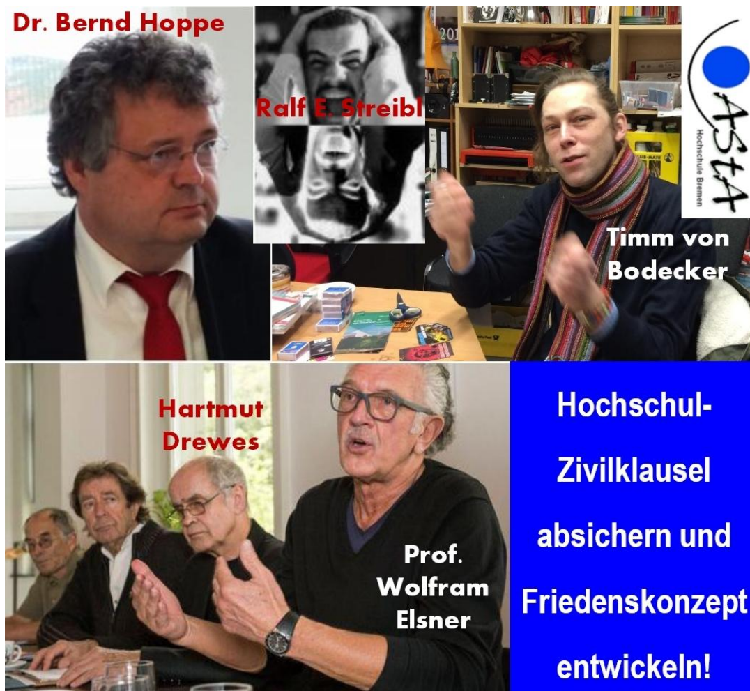
Foto-Collage aus Bildern der monatelangen Vorbereitung zum Treffen mit dankbarem Rückgriff auf veröffentlichte Bilder aus dem Weser-Kurier.

Dazu als optischer Leckerbissen eine Foto-Collage mit einigen der benannten Aktiven.