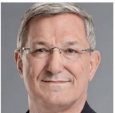
Listenplatz 1 Bernd Riexinger Stuttgart